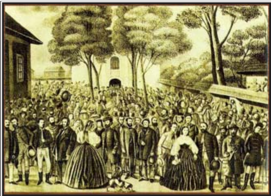
Memorandum národa slovenského 1861–2011

Litografiu Národné zhromaždenie pod lipami vyhotovili v „kameňotiskárni A. J. Malika v Levoči“ podľa fotografie F. Koutníka