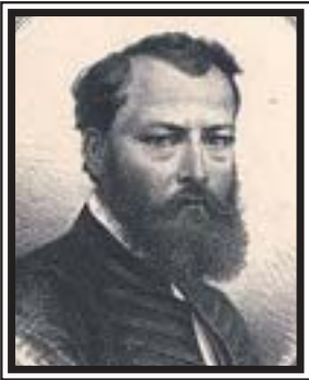
Štefan Marko Daxner