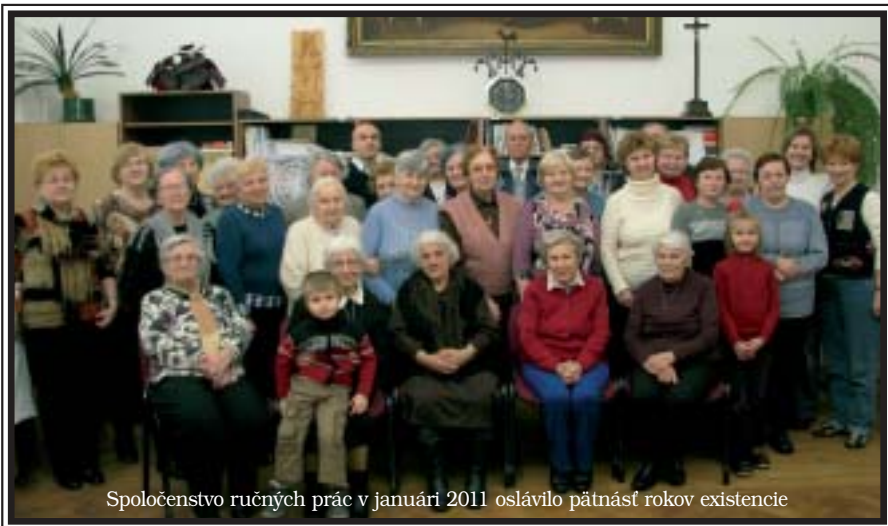
Spoločenstvo ručných prác v januári 2011 oslávilo pätnásť rokov existencie